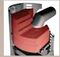
Speicher PowerBloc (Zubehör)