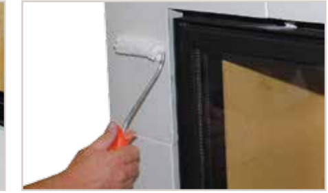
Creativ Metallico 76 mit der Microfaser-Farbwalze auftragen...