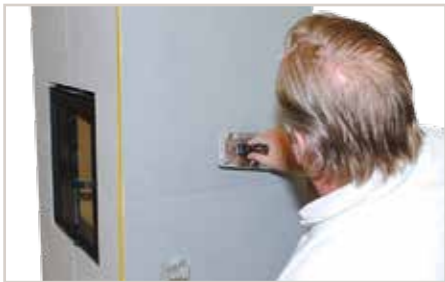
Nach dem Antrocknen wiederholt in kreisenden Bewegungen mit der gesamten Kellenfläche über die Oberfläche streichen.

Tipp: Fugen müssen abgeklebt werden, wenn diese sichtbar bleiben sollen. Sentimento 78 im sehr flachen Winkel mit der Effekt-Glättekelle abziehen (nicht mit der Kellenkante!). Immer diagonal (in kleinen Wellen von links unten nach rechts oben bzw. rechts unten nach links oben) abziehen.