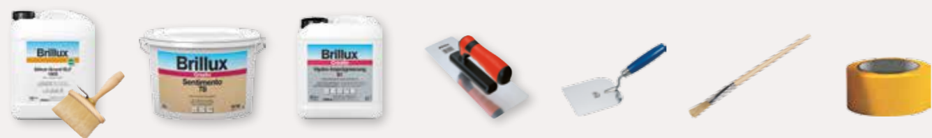
Silikat-Grund ELF 1803, Streichbürste oval 1175