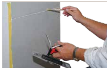
Fugen mit Pinsel nachziehen um ein gleichmäßiges Fugenbild zu erreichen.