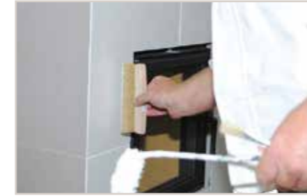
...und die gewünschte Struktur mit dem Deko-Wischer erstellen.