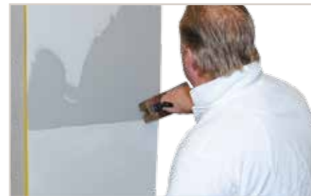
2. Dekogang – siehe 1. Dekogang.