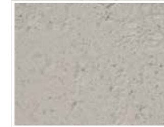
S14 mit Oberflächenveredelung Camina Sichtbetonoptik

Für alle, die das puristische Design der Anlagen bevorzugen, das durch die Fertigung der einzelnen Teile entsteht, eignet sich am besten die Camina Sichtbetonoptik. Dadurch lässt sich eine ebene Oberfläche in Betonoptik herstellen, die eventuelle fertigungsbedingte Unebenheiten im Material verdeckt.