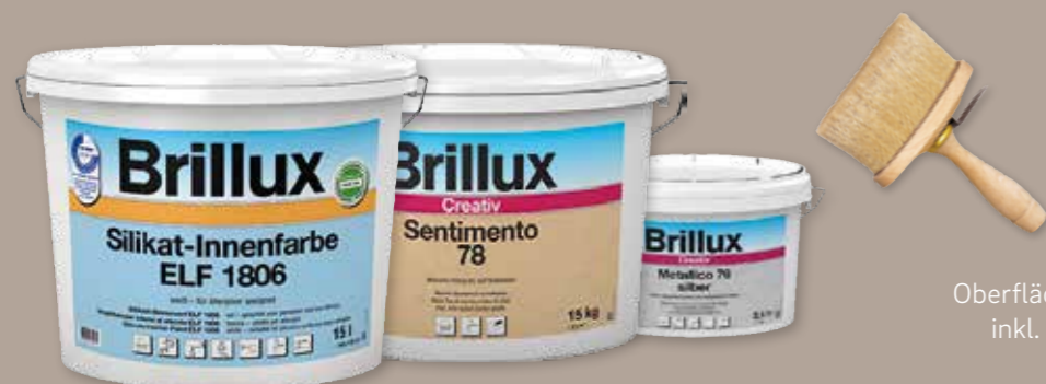
Abb. Titelseite S9 Maxi Oberflächenveredelung: Camina Silikatanstrich inkl. Schmid Kamineinsatz Ekko 45(45)80 h

Wir wünschen Ihnen viel Freude mit Ihrer neuen Speicherstein-Anlage!