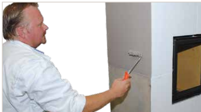
Die Anlage kann auch mit der Microfaser-Farbwalze beschichtet werden.

Tipp: Farbe immer in eine Richtung rollen (nicht herauf und herunter).