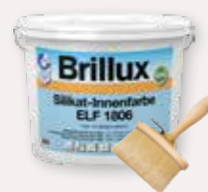
Silikat-Innenfarbe ELF 1806, Streichbürste oval 1175