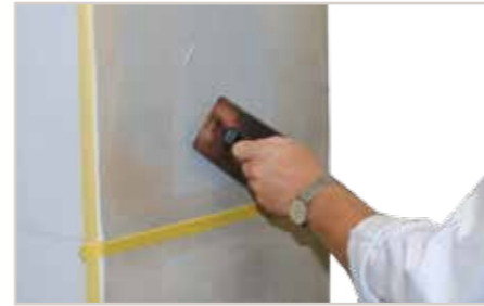
1. Dekogang Creativ Sentimento 78 „in 1-facher Kornstärke“ mit Effekt-Glättekelle auftragen.