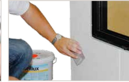
Unebenheiten nach dem Trocknen mit dem Schleif-Schwamm angleichen.