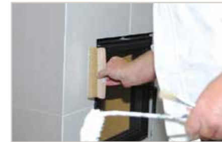
...und die gewünschte Struktur mit dem Deko-Wischer erstellen.

Tipp: Creativ Metallico 76 satt mit der kleinen Kurzflor Farbwalze auftragen und „kreuz und quer“ durchrollen. Kurz warten und mit Brillux Deko-Wischer die gewünschte Struktur kreuz und quer ziehen. Ausbesserungen an der Anlage vor der Beschichtung sind auch mit Brillux 2K-Uni-Polyesterspachtel 667 möglich.