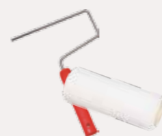
Format-Steckbügel 1101, Microfaser-Farbwalze 1221