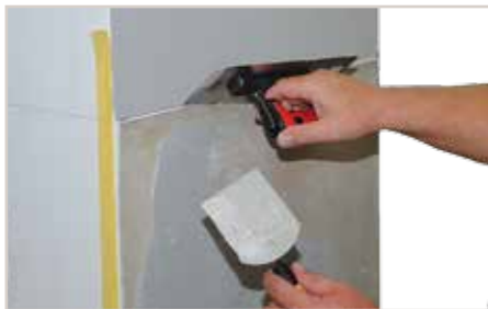
Abziehen mit Effekt-Glättekelle.