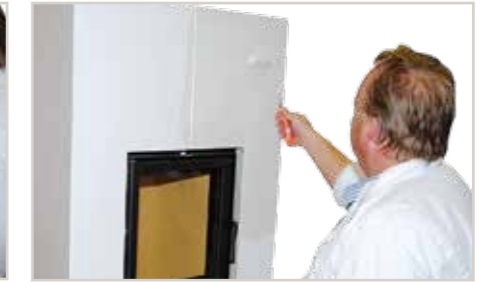
Creativ Metallico 76 mit der Microfaser-Farbwalze auftragen...