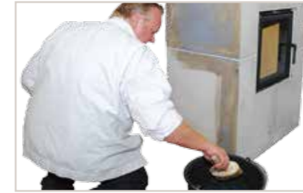
Lacryl Tiefgrund ELF 595 gleichmäßig auftragen.