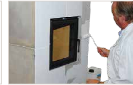
Grundanstrich 2x mit Super Latex ELF 3000