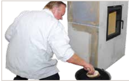
Silikat-Grund ELF 1803 1:1 mit Wasser verdünnen und gleichmäßig auftragen.