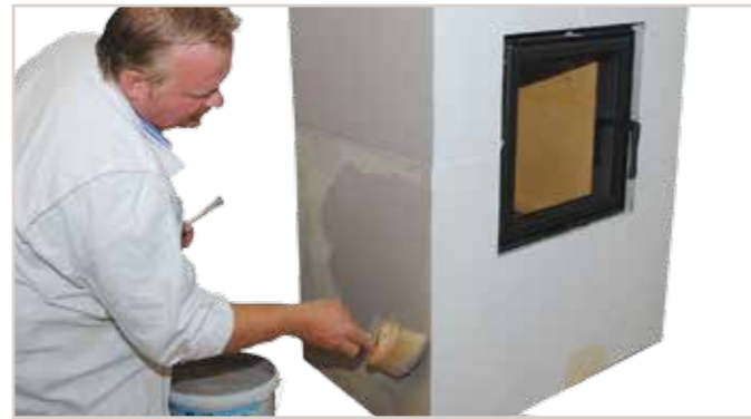
Anlage 2x mit Silikat-Innenfarbe ELF 1806 und der Streichbürste oval beschichten. Der Auftrag mit der Streichbürste wirkt wolkiger!