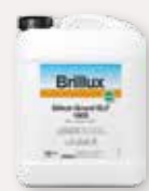
Silikat-Grund ELF 1803