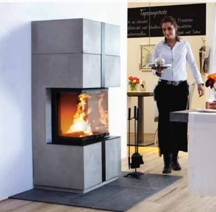
Camina S16 mit Ekko U45(34)51 h bearbeitet mit Camina Sichtbetonoptik